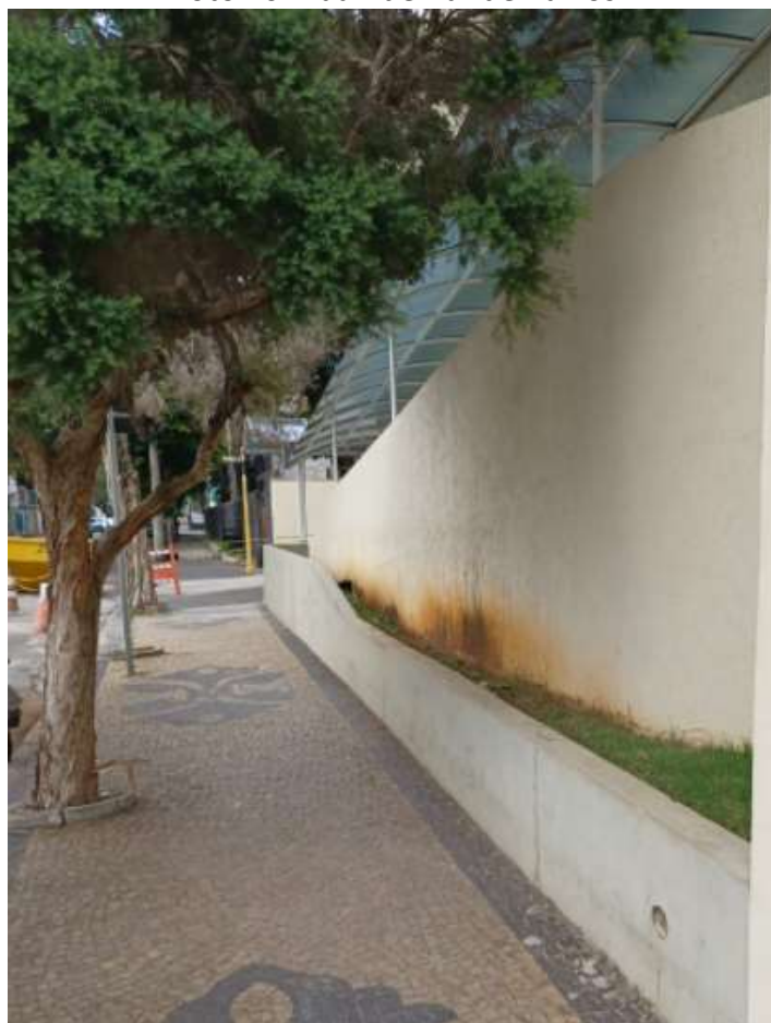
Foto 11- Rua Ademar de Barros